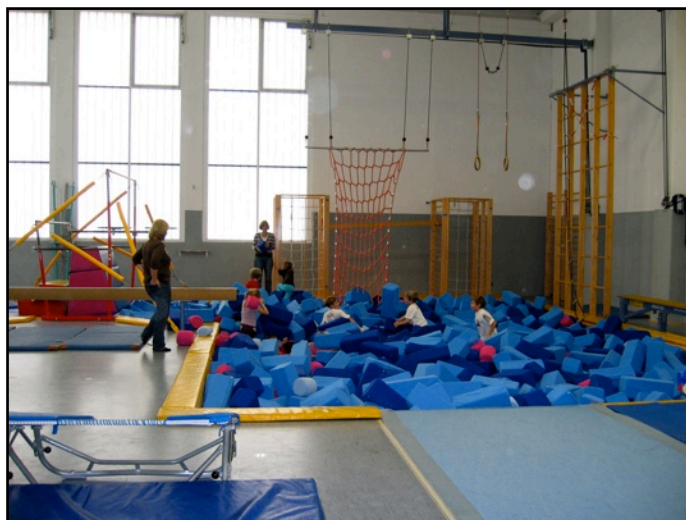
Paladion Böblingen - Oktober 2009