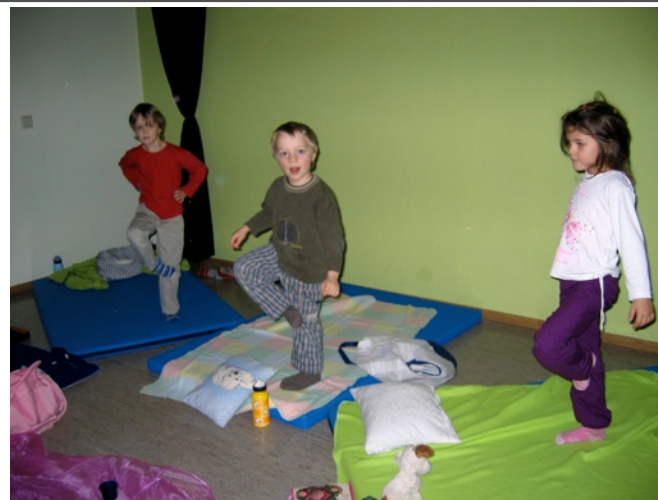
Entspannung für 1. und 2. Klasse - November 2009