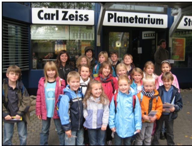
Besuch im Planetarium Stuttgart - Oktober 2009